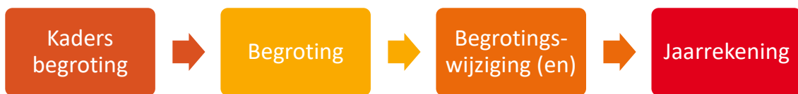
Figuur 1: proces begroting en verantwoording VRU

De gemeenten worden in de gelegenheid gesteld om hun zienswijze over de algemene financiële en beleidsmatige kaders naar voren te brengen. Alle zienswijzen worden betrokken bij het opstellen van de begroting van 2025 en de geactualiseerde begroting 2024. Voordat het bestuur de begroting 2024 definitief vaststelt, wordt deze eveneens voor zienswijzen aan de gemeenten aangeboden. De gemeenten hebben op deze manier twee gelegenheden om invloed uit te oefenen op de begroting van de VRU.